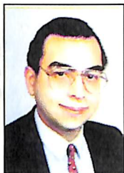
د. أحمد خالد توفيق